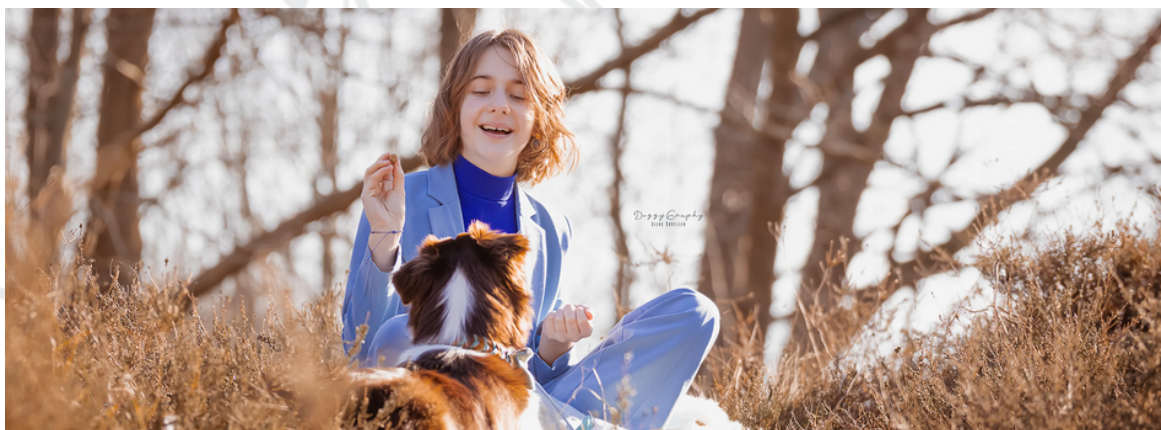
Leah en Lexi DoggyGraphy